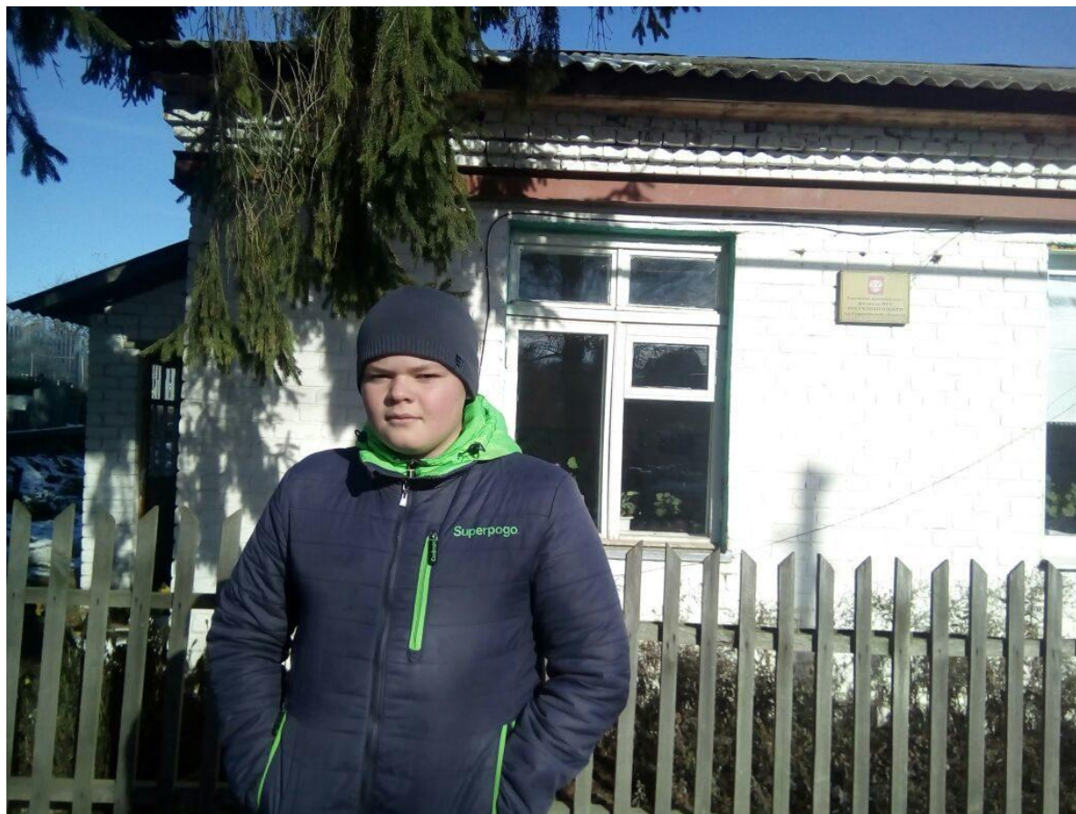
Семенная инспекция р.п. Турки